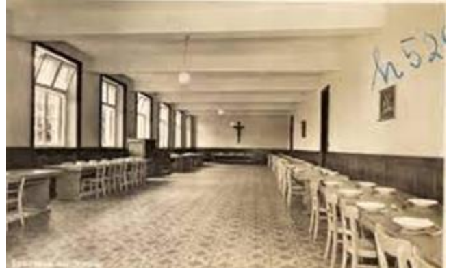
Bild1: Das Refektorium der Schüler Anfang der 1950er Jahre

Wandel und die Entwicklung der Schule, aber auch für ihre Kontinuität! Die Bilder zeigen zwei verschiedene Funktionen des „Hörsaals“ (Bild1: Refektorium-/Speisesaal der Schüler*innen; Bild 2: Lernzentrum für die Oberstufenschüler*innen). Was diese Funktionen des beeindruckenden Raumes betrifft, steht in beiden Fällen das Wohl der Schüler*innen im Mittelpunkt! Als Lernzentrum steht der „Hörsaal“ ab sofort den Oberstufenschülern*innen zur Verfügung.