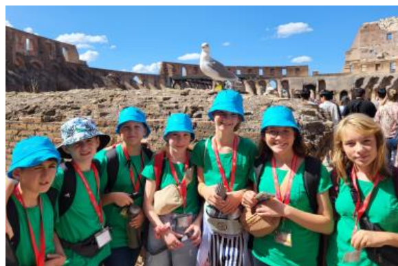
Schülergruppe im Kolosseum