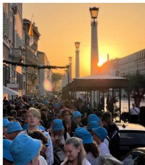
Gespanntes Warten auf Einlass zur Papstaudienz