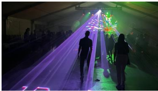
Gemeinsame Abschlussparty im Zelt

Wir haben tolle und bleibende Eindrücke der „Ewigen Stadt“ erhalten, religiöse Impulse erlebt, die authentisch und bewegend waren! Wir haben Gemeinschaft erfahren und gelebt, auf dem Campingplatz, in den Bungalows, bei Spaziergängen, bei Gesprächen, beim Schwimmen oder Fußballspielen! All dies wäre ohne die Zusammenarbeit eines großen Teams nicht möglich gewesen! Ein großes Dankeschön geht an alle, die mitgemacht und mitgestaltet haben! Das Bild zeigt