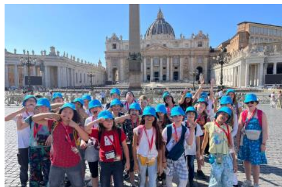
Schülergruppe auf dem Petersplatz vor dem Petersdom