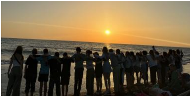
Schülergruppe am Strand beim Sonnenuntergang