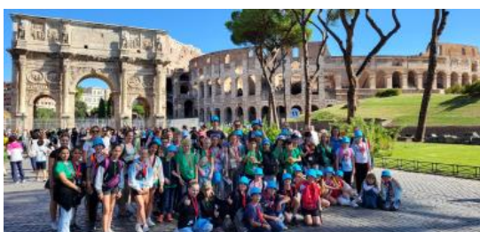
Schülergruppe vor dem Kolosseum und dem Forum Romanum