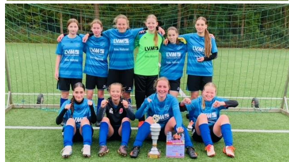
Bilder und Urkunden der erfolgreichen Fußballteams