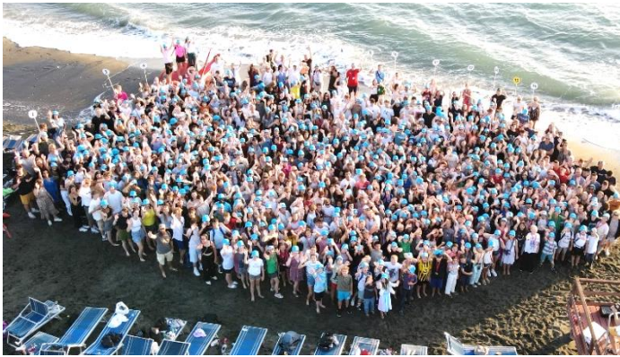
(Die gesamte Schulgemeinde am Strand bei Rom)

ich melde mich in diesem Jahr ein letztes Mal per Bardel-Info bei Ihnen und Euch. Ich möchte mich ganz herzlich bei der gesamten Schulgemeinde für die sehr gute und enge Zusammenarbeit, den offenen und konstruktiven Dialog und die vielen schönen Begegnungen bedanken. Die unvergessliche Fahrt der gesamten Schulgemeinde nach Rom in diesem Jahr steht für diese Erfahrung!