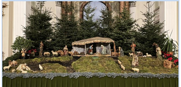
(Bardeler Krippe in der Klosterkirche im Advent 2023)