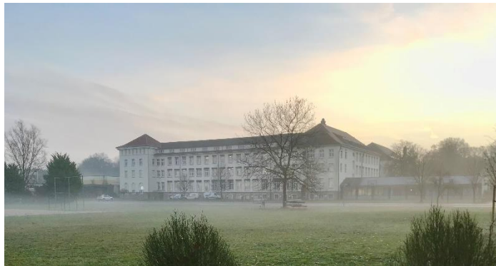
Das Missionsgymnasium an einem Wintermorgen

Unsere Schule ist unser gemeinsamer Lebens- und Arbeitsraum. Wir sollten diesen hüten und pflegen, damit wir alle gut zusammenarbeiten und uns wohlfühlen können. Leider fehlen in mehreren Räumen seit kurzer Zeit die Heizungsthermostate (2.13, 2.15, 230) und z.T. sind die Schellen von Heizungsrohren abgerissen worden. Ich bitte inständig darum, Dinge im Schulgebäude nicht mutwillig zu zerstören. Setzen wir uns alle für unsere Schule ein!