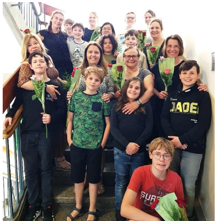
Der Bardel Boys Choir nach dem Konzert