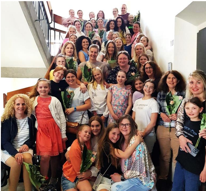
Der Mädchenchor nach dem Konzert