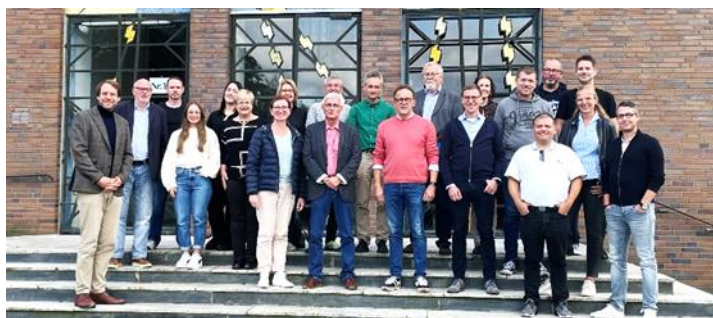
Ehemalige feiern das Wiedersehen

Die Möglichkeit eines Wiedersehens haben einige ehemalige Abiturientinnen und Abiturienten am vergangenen Samstag genutzt. Bei Kaffee und Kuchen konnten wir uns in geselliger Runde über Vergangenes und auch über die Entwicklung des Missionsgymnasiums austauschen. Ein Rundgang durch die Schule durfte natürlich auch nicht fehlen. Ein großes Dankeschön geht an meine Kollegen Herrn